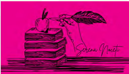
Diaconado para la mujer: un ministerio posible y necesario