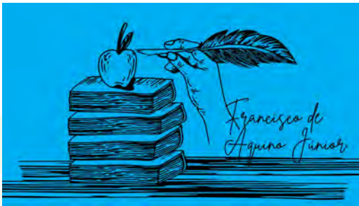
Francisco y la sinodalidad