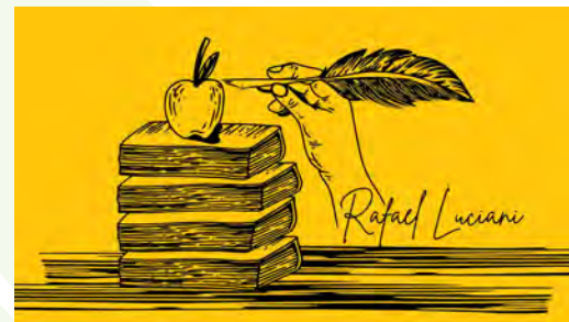
La sinodalidad, una forma más completa de ser y proceder en la Iglesia