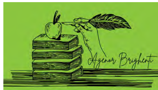
Iglesia sinodal en misión. Convergencias y divergencias a partir del Informe de Síntesis